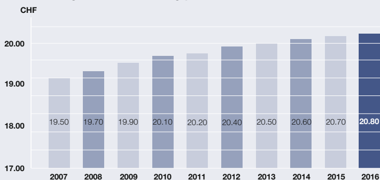
Entwicklung der Ausschüttung pro Anteil