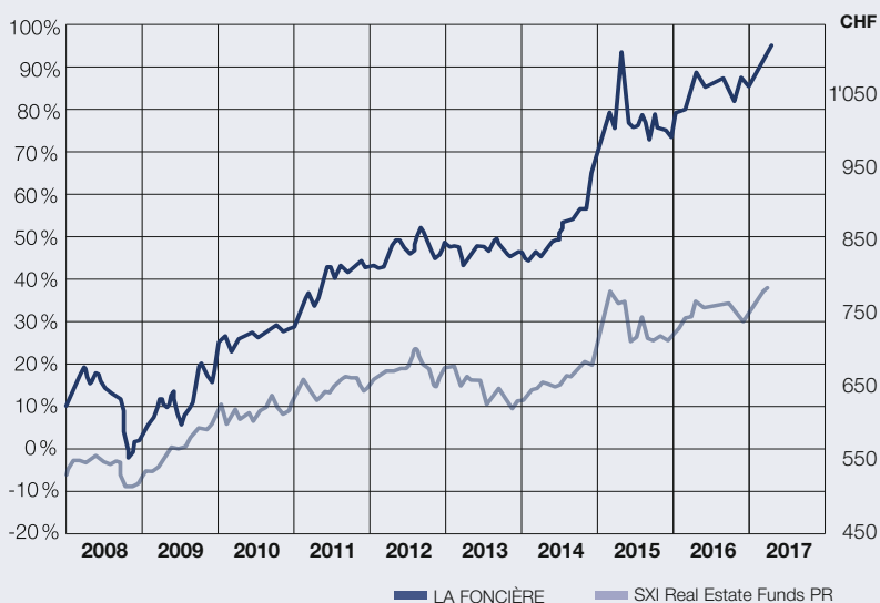
Börsenkursentwicklung vom 01.01.2008 bis 31.03.2017