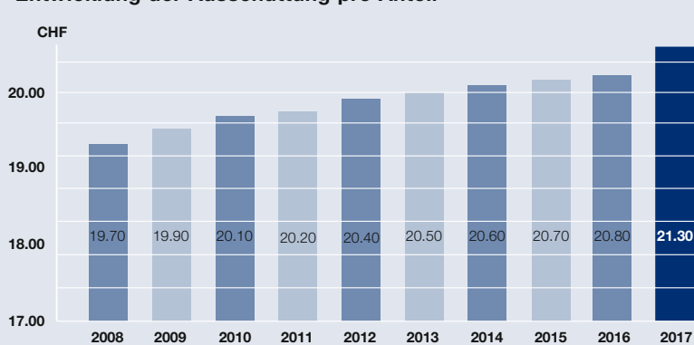
Entwicklung der Ausschüttung pro Anteil