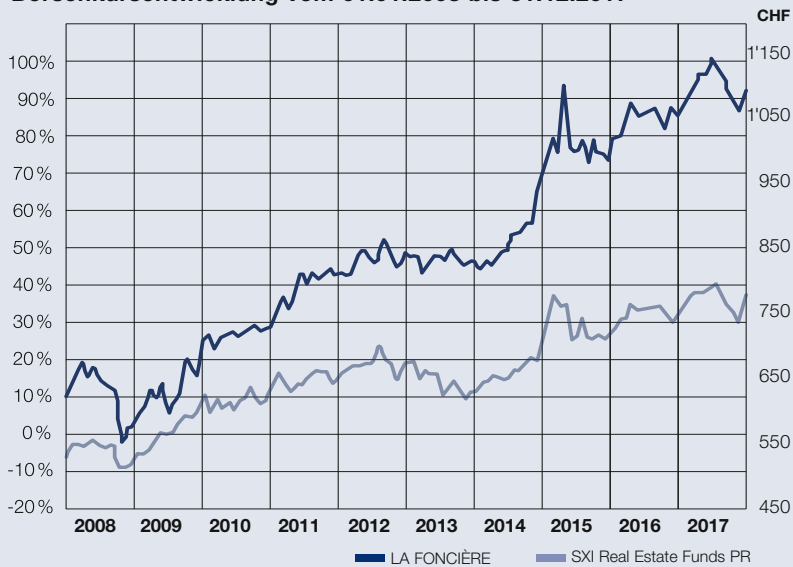
Börsenkursentwicklung vom 01.01.2008 bis 31.12.2017