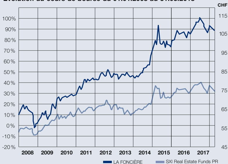
Evolution du cours de bourse du 01.01.2008 au 31.03.2018