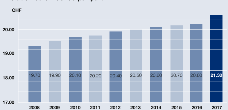
Evolution du dividende par part